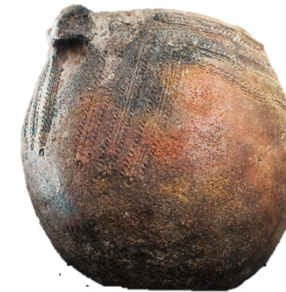
Cuenco con decoración impresa (Cueva Santa, Caudete). VI-V milenio a.C. Neolítico antiguo.