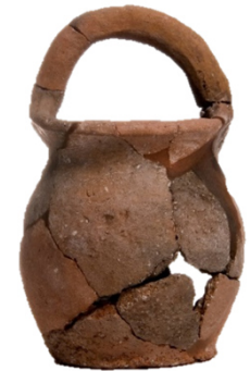
Vaso con asa de cesta (El Amarejo, Bonete). Ss. IV-III a.C. Ibérico.