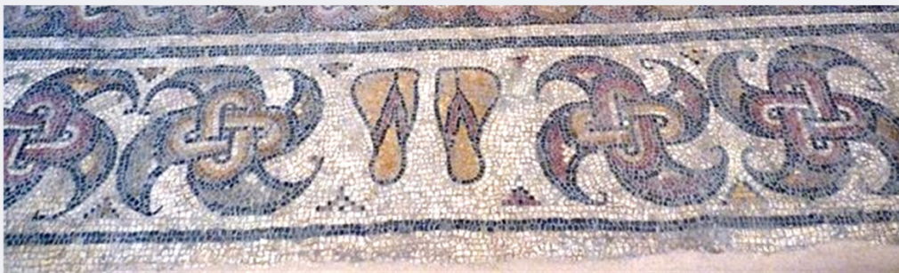
Mosaico de las sandalias (detalle), Villa de Balazote, Museo de Albacete.

2ª. Práctica. En el aula de didáctica: composición y fabricación de pequeños mosaicos por parte de los participantes.