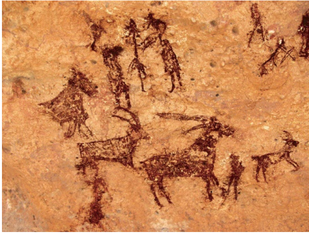
Abrigo Grande de Minateda, detalle (Hellín, Albacete). Arte rupestre levantino. (Imagen. lacerca.com).