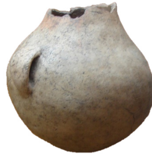
Botella (Abrigo del Molino del Vadico, Yeste). Ca. VI-V milenio a.C. Neolítico inicial.