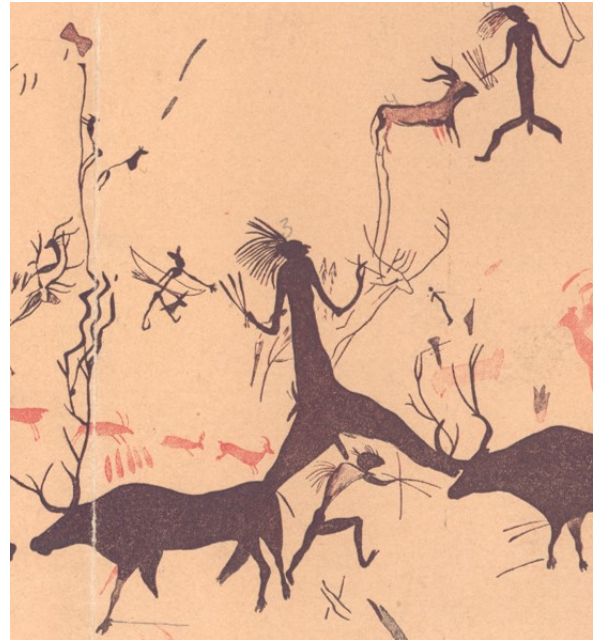
Cueva de la Vieja, detalle (Alpera, Albacete). Arte rupestre levantino. (Imagen. Museo de Albacete).

Duración aproximada: entre una hora y media y dos horas.