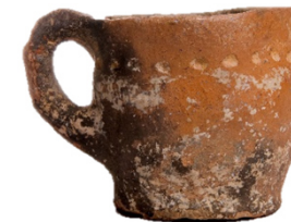
Jarra (El Amarejo, Bonete). S. IV-III a.C. Ibérico.