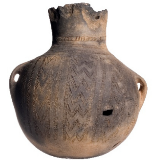
Botella con decoración incisa (Cueva del Niño, Ayna). V-IV milenio a.C. Neolítico antiguo.