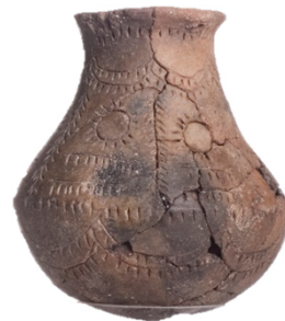
Botella (El Cuchillo, Almansa). Ca. III milenio a.C. hallada en un yacimiento de la Edad del Bronce.