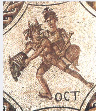
Mosaico de Hellín en el Museo Arqueológico Nacional. El mes de octubre: joven vaciando un cesto con uvas, detrás el dios Marte.