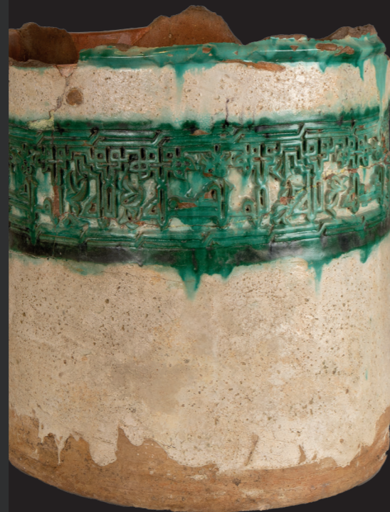
Brocal de aljibe. Siglo XIV. Taller del Moro (Toledo)