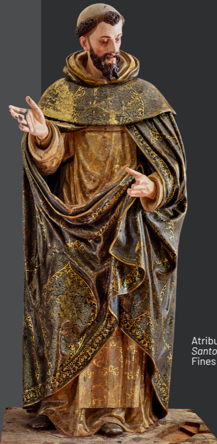
Atribuido a Giraldo de Merlo. Santo Domingo de Guzmán . Fines s. XVI - Inicios s. XVII