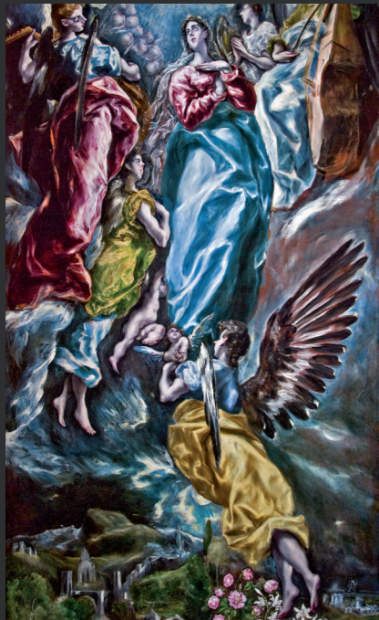
El Greco. La Inmaculada Concepción . 1608 - 1613

El conjunto ofrece un variado repertorio de temas religiosos con extensa cronología, que abarca desde el establecimiento en Toledo del pintor, en 1577, hasta su muerte, en 1614, y compendian toda la evolución artística y técnica de su vasto período español. A destacar, la Inmaculada "Oballe", una de sus obras cumbre.