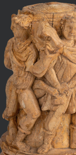
Relieve de Hipólito. Siglo IV d.C. Circo Romano (Toledo)

El museo de Santa Cruz es el museo provincial de Toledo y, por tanto, el receptor de todos los bienes arqueológicos de la provincia. Se ofrece en la última sala una muestra que recorre todos los periodos históricos representados en el territorio provincial, desde el Paleolítico, pasando por todas las etapas de la Prehistoria, Edad Antigua, Medieval e inicios de la Edad Moderna, con especial detenimiento en las manifestaciones artísticas que entroncan con su pasado andalusí.