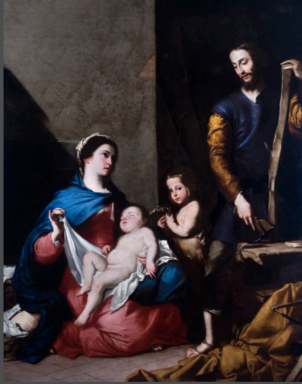
José de Ribera. La Sagrada Familia . 1639