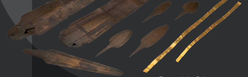
Tesoro de La Paloma. Calcolítico (2.300-1.800 a.C.). Finca "La Paloma" (Pantoja)