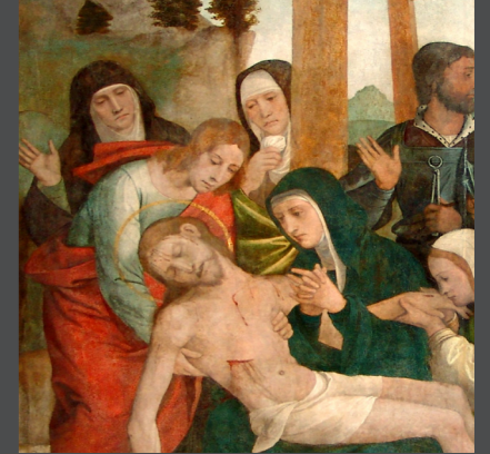
Juan de Borgoña. La Piedad . ca. 1500 - 1505

En 1844 se crea el Museo Provincial de Toledo y, tras varias décadas sin una sede fija, en 1919 las colecciones se instalan en el antiguo Hospital de Santa Cruz, edificio del siglo XVI, construido bajo el patrocinio del cardenal Pedro González de Mendoza, que había mantenido su función original hasta mediados del siglo XIX, cuando pasa a depender del Ejército, hasta su reconversión en museo en los años 30 del siglo XX.