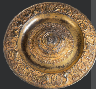
Bandeja de plata dorada. Siglo XVI

En el pequeño espacio abierto a la segunda sala dedicada al Greco, se ha querido representar una "cámara de las maravillas" o "gabinete de curiosidades", con algunas de las piezas de orfebrería, en su mayoría de carácter religioso, más importantes de las colecciones del museo. Se completa con objetos curiosos, de diferente naturaleza, con el objeto de transmitir la riqueza y variedad de las colecciones del museo.