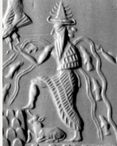
Sello, Mesopotamia Museo Británico, Londres