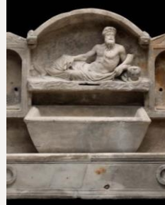
Fuente con imagen de río Museo de Bellas Artes, Boston