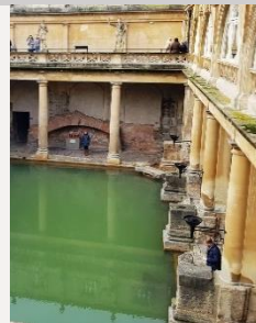
Termas romanas Bath, Inglaterra