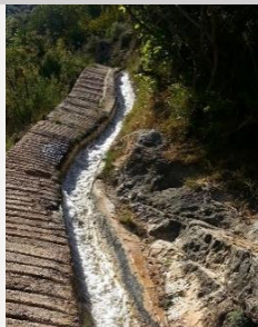
Acequia, Los Millares (Almería)