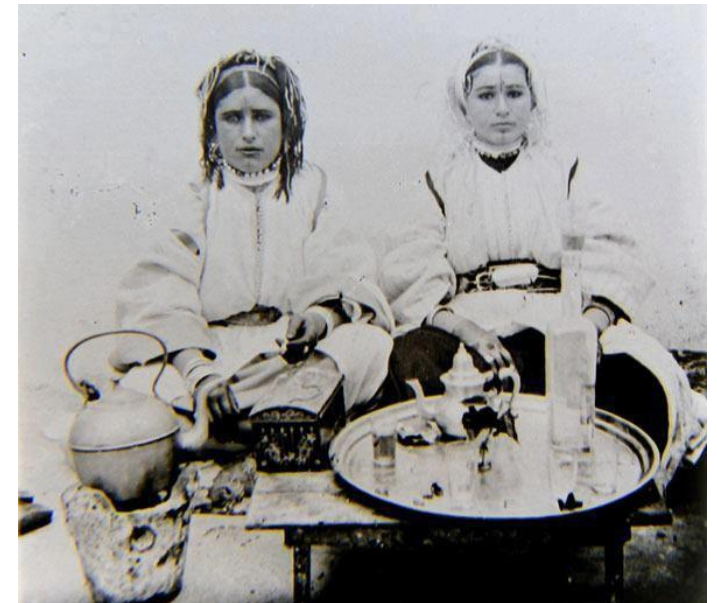
Mujeres beréberes del Rif, s. XX