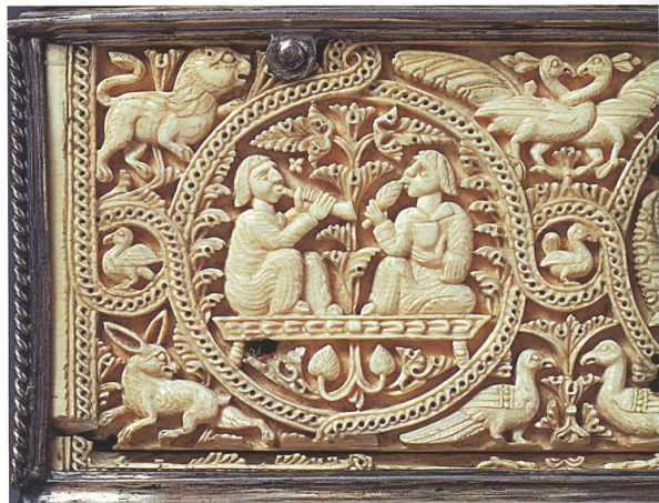
Frente de arqueta omeya en marfil s. XI-XI Museo Victoria & Albert, Londres

El mobiliario en época andalusí era sencillo, arcones, arquetas, una mesa baja de función múltiple, y hornacinas en los que depositar objetos o luminarias como los candiles. Para completar esteras, alfombras y almohadones.