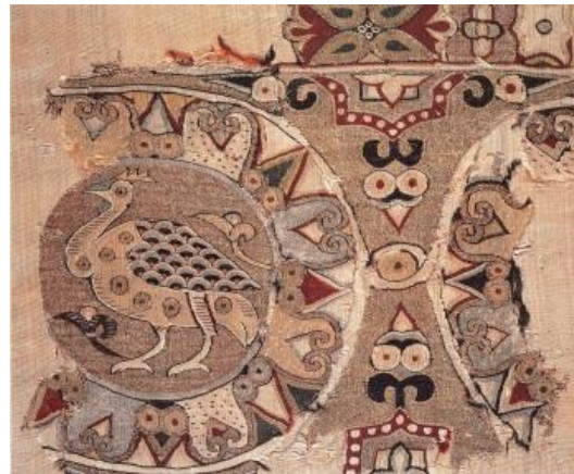
Franja de los pavos reales o del Pirineo Guarnición decorativa realizada con la técnica del tapiz. S. X. Museo: Instituto Valencia de Don Juan