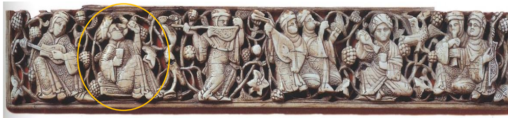
Placa fatimí s. XI-XII Museo de arte islámico, Berlín

El mobiliario en época andalusí era sencillo, arcones, arquetas, una mesa baja de función múltiple, y hornacinas en los que depositar objetos o luminarias como los candiles. Para completar esteras, alfombras y almohadones.