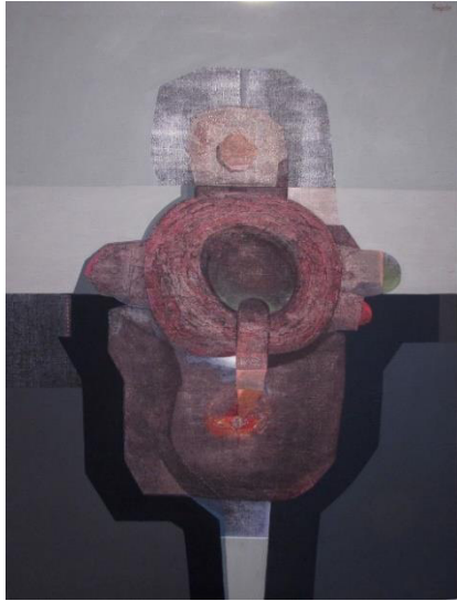
Alfonso Quijada, Sin título , acrílico sobre lienzo, 1975, 128 x 96 cm, Inv.: CE17173, Museo de Albacete

Su obra ha enriquecido la historia de la pintura de las vanguardias del siglo XX en Albacete y está considerado el pionero de la abstracción en esta provincia, así como una figura destacada en la plástica española contemporánea en Castilla-La Mancha.