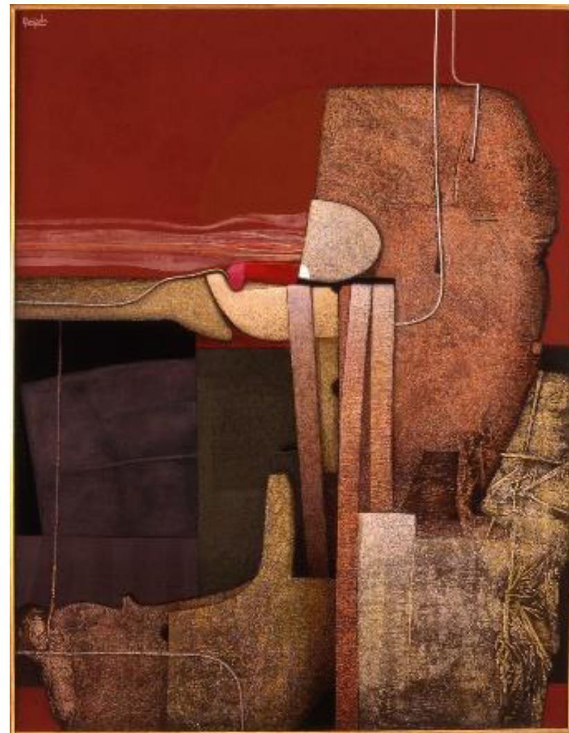
Alfonso Quijada, Sin título , óleo sobre lienzo, 1990, Inv.: CE17.184, Museo de Albacete

En la trayectoria artística de Quijada se diferencian tres etapas. Una primera desde 1956 hasta 1960. Es la época de sus años universitarios, momento en el que inicia su formación y aprendizaje artístico de una manera autodidacta, moviéndose por un academicismo figurativo. Una segunda entre 1961 y 1978. Es el periodo de la abstracción matérica, de la pintura informalista, existiendo una clara influencia de Tapies sobre la textura de las obras de esta época. Una tercera de 1979 a 1994, la de mayor desarrollo a nivel técnico. Junto a la materia pictórica, muestra también un interés por la luz, iluminando toda la composición o un determinado punto que quiere resaltar; por el espacio y por el volumen a través de formas escultóricas rotundas que se recortan en unos fondos planos de tonos grises-negros, recordándonos las obras de Ferreras.