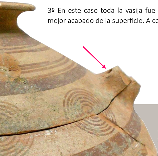
HOYA DE SANTA ANA (CHINCHILLA) SEPULTURA 70

5º Cocción en el horno, en este caso en una atmósfera oxidante para obtener el color final.