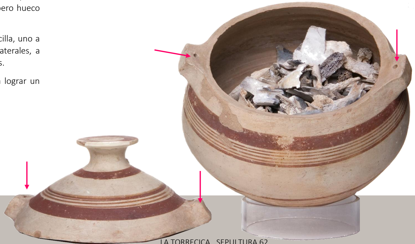
LA TORRECICA, SEPULTURA 62