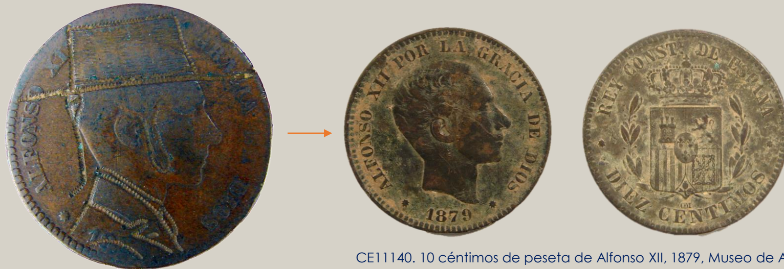
CE11140. 10 céntimos de peseta de Alfonso XII, 1879, Museo de Albacete

Hubo tres emisiones de estas monedas de 10 céntimos (1877, 1878 y 1879) y circularon hasta 1939