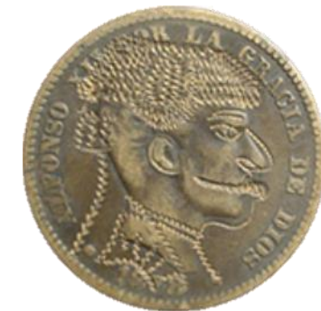
Moneda dedicada a Juan Belmonte (García Herrero, 2014, fig. 81)

En esa costumbre es donde se encuadran los retratos de toreros en monedas. No como burla, al revés, ensalzando a los héroes del momento, los toreros.