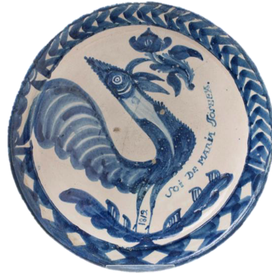
Fuente, 1819, Inv.: 30.050, Museo del Cau Ferrat, Sitges (Barcelona)