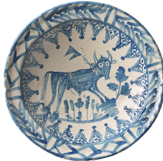
Fuente, primer tercio del S. XIX, Inv.: 30.037, Museo del Cau Ferrat, Sitges (Barcelona)