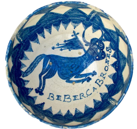
Cuenco, primer tercio del S. XIX, Inv.: CE18.473, Museo de Albacete