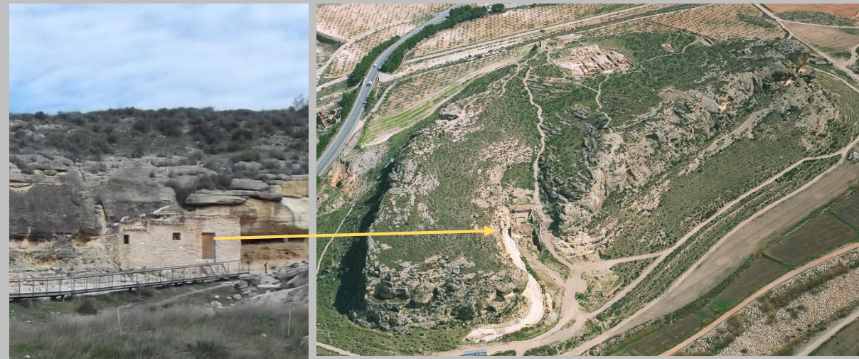
La antigua casa-cueva restaurada, con indicación de su situación en El Reguerón, la vaguada de acceso a la zona alta.

Trillmich, W., 1982, „Ein Kopffragment in Menda und die Bildnisse der Agrippina Minor aus den hispanischen Provinzen“, Homenaje a Sáenz de Buruaga , Madrid, páginas 109-121.