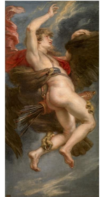
Júpiter enamorado del príncipe troyano Ganimedes, lo rapta convertido en águila