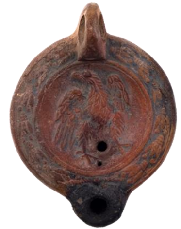
Los Caserines (Tiriez, Lezuza) Nº Inv.: CE1339 Museo de Albacete, sala 5