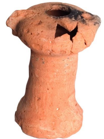
Bienservida. Con pie alto para elevarla Nº Inv.: CE9371 Museo de Albacete, sala 5