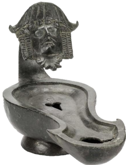
Los Torreones (El Salobral, Albacete). Asa con máscara teatral. Nº Inv.: CE13844 Museo de Albacete, sala 5

http://colonia-augusta-emerita.blogspot.com/2009/07/la-lucerna.html