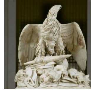
Apoteosis de Claudio Taller romano. Andrea Calamecca. El águila y las armas pertenecían a un monumento funerario de época de Augusto (27 a. C.-14 d. C.)

El águila reina en los cielos como la más poderosa de las aves, y así, el dios a veces se transforma en águila, cabalga sobre ella, o la usa como mensajera para otorgar la victoria. Los generales llevaban el cetro de águila en los paseos triunfales, las legiones la usaban como estandarte, y por ello también fue símbolo del emperador Carlos V.