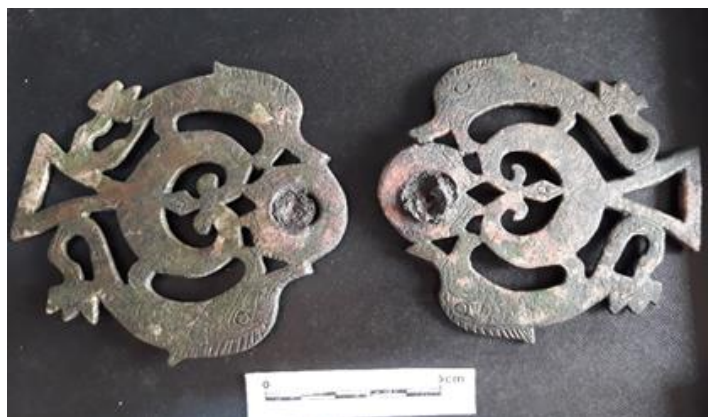
Nº de inventario AA/83/1/15-16. Ercavica