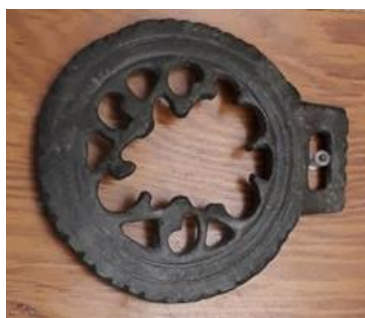
Nº de inventario AA/74/754. Valeria