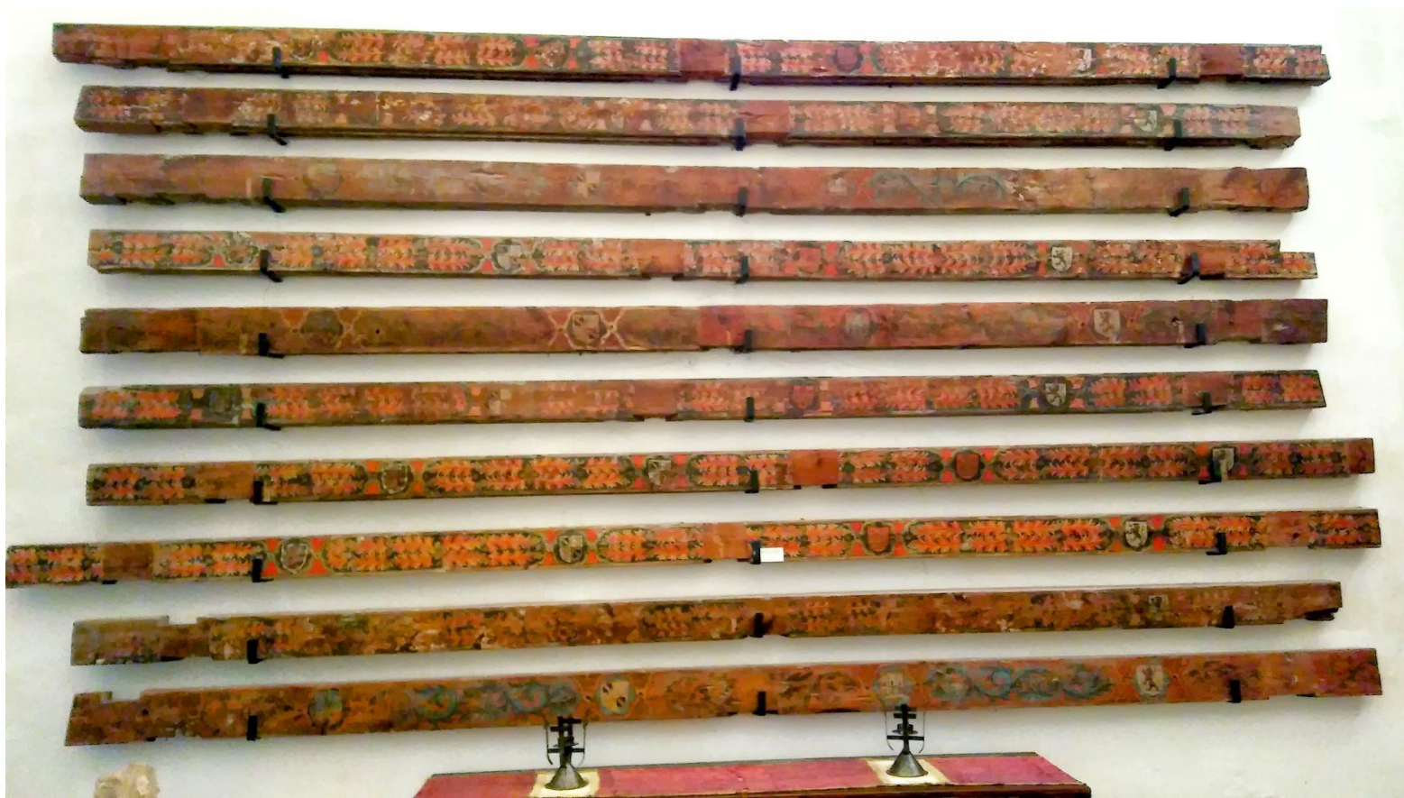
Montaje actual de los tirantes en el lado de la epístola. Iglesia de Santa María del Salvador, Chinchilla de Montearagón (Albacete)

Se datan en torno a 1445-1458, debido a que los tirantes que se conservan completos (de 566 cm de longitud) llevan pintados cuatro motivos heráldicos correspondientes a los escudos de los reinos de León y de Castilla, de don Juan Pacheco (I Marqués de Villena, entre 1445 a 1468) y del obispo don Diego de Comontes (diócesis de Cartagena) que ocupó la sede entre 1446 y 1458. La presencia de la heráldica de don Juan Pacheco y del obispo de Comontes permite datar en un arco temporal de trece años la construcción de las cubiertas lignarias bajomedievales.