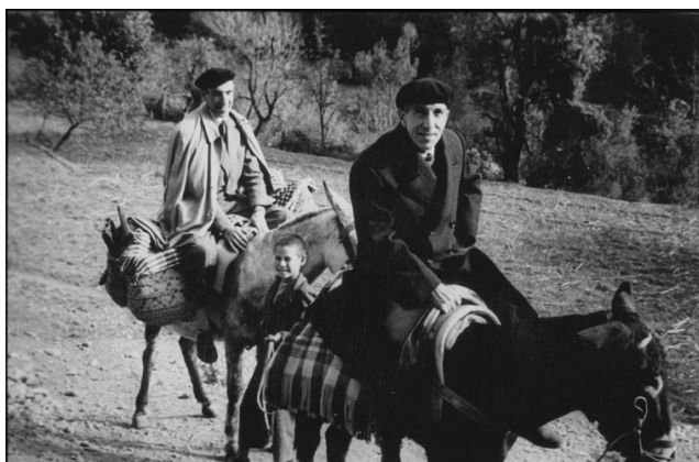
Textos y fotografías: © Museo de Albacete

Clasificación genérica: fondo documental